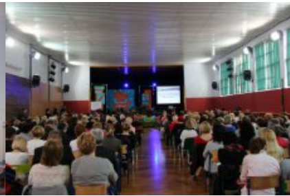
Konferencja „Wiem, co jem – jak wdrażać w szkole od 1 września 2015 r. nowe prawo w zakresie żywienia?” w Płocku