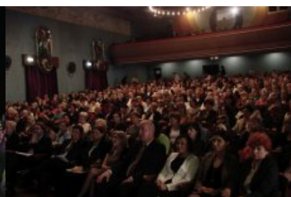
Konferencja „Wiem, co jem – jak wdrażać w szkole od 1 września 2015 r. nowe prawo w zakresie żywienia?” w Radomiu