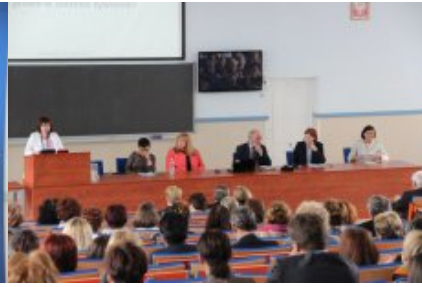
Konferencja „Wiem, co jem – jak wdrażać w szkole od 1 września 2015 r. nowe prawo w zakresie żywienia?” w Ciechanowie