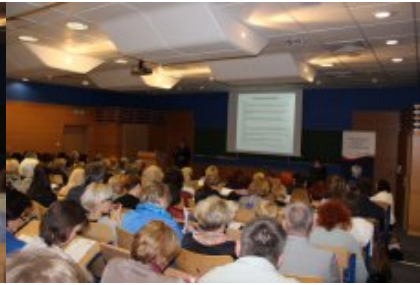
Konferencja „Wiem, co jem – jak wdrażać w szkole od 1 września 2015 r. nowe prawo w zakresie żywienia?” w Siedlcach