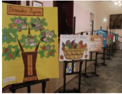
Konferencja „Wiem, co jem – jak wdrażać w szkole od 1 września 2015 r. nowe prawo w zakresie żywienia?” w Radomiu