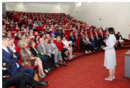
Konferencja „Wiem, co jem – jak wdrażać w szkole od 1 września 2015 r. nowe prawo w zakresie żywienia?” w Ostrołęce