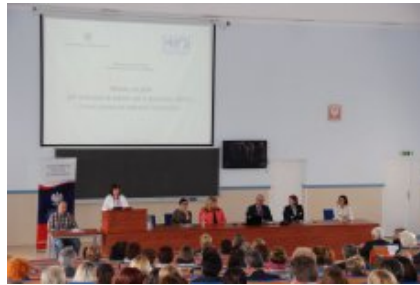
Konferencja „Wiem, co jem – jak wdrażać w szkole od 1 września 2015 r. nowe prawo w zakresie żywienia?” w Ciechanowie