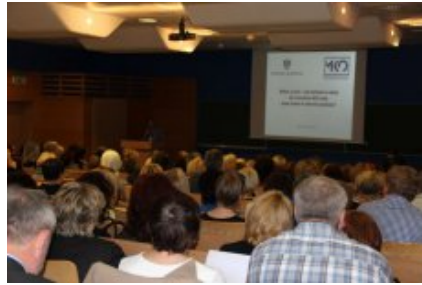
Konferencja „Wiem, co jem – jak wdrażać w szkole od 1 września 2015 r. nowe prawo w zakresie żywienia?” w Siedlcach