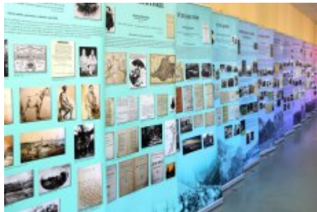
Edukacja dla Polaków na Wschodzie - konferencja