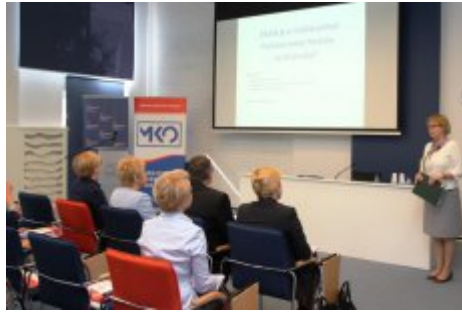
Edukacja dla Polaków na Wschodzie - konferencja