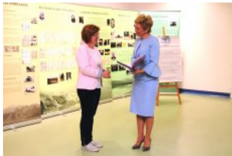
Edukacja dla Polaków na Wschodzie - konferencja