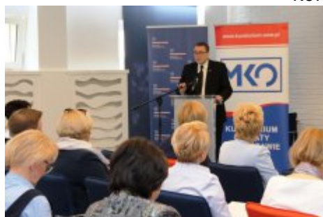
Edukacja dla Polaków na Wschodzie - konferencja