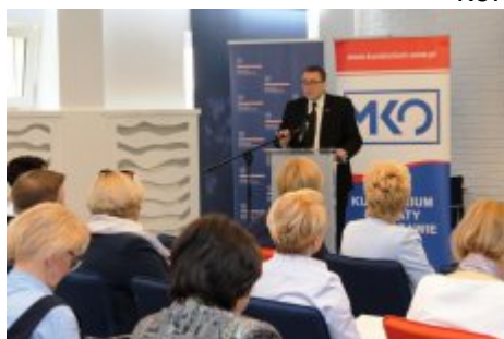
Edukacja dla Polaków na Wschodzie - konferencja