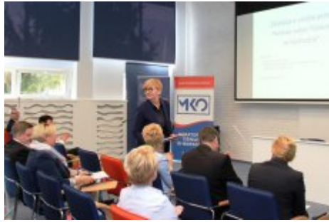
Edukacja dla Polaków na Wschodzie - konferencja