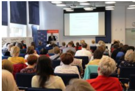
Edukacja dla Polaków na Wschodzie - konferencja