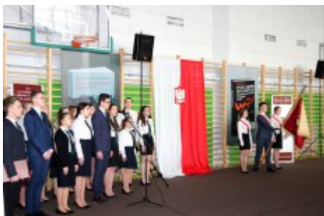
W hołdzie młodzieży antykomunistycznej - Dzień „Żołnierzy Wyklętych”