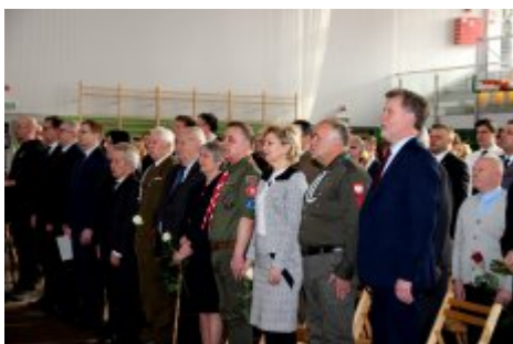
W hołdzie młodzieży antykomunistycznej - Dzień „Żołnierzy Wyklętych”