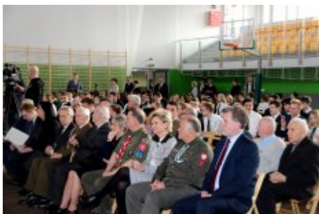
W hołdzie młodzieży antykomunistycznej - Dzień „Żołnierzy Wyklętych”