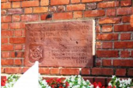
74. rocznica wybuchu Powstania Warszawskiego