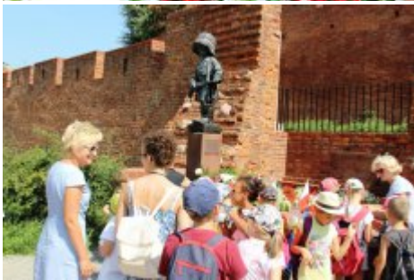
74. rocznica wybuchu Powstania Warszawskiego