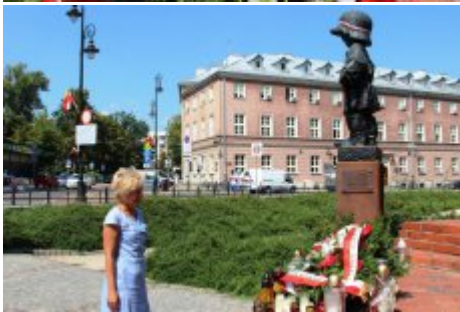
74. rocznica wybuchu Powstania Warszawskiego