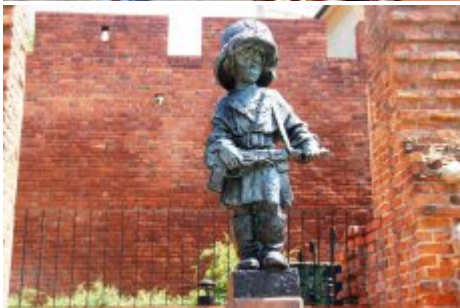
74. rocznica wybuchu Powstania Warszawskiego