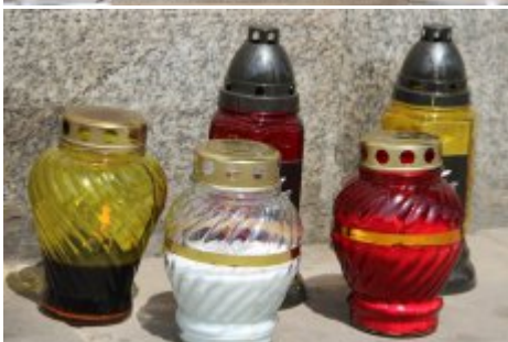
74. rocznica wybuchu Powstania Warszawskiego