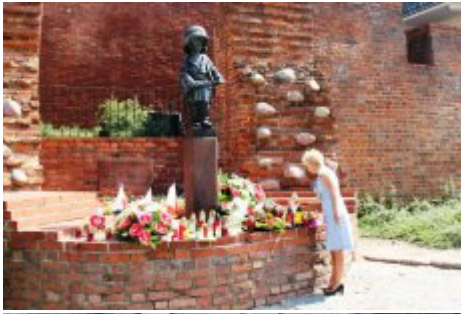
74. rocznica wybuchu Powstania Warszawskiego