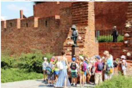
74. rocznica wybuchu Powstania Warszawskiego