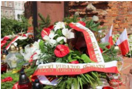
74. rocznica wybuchu Powstania Warszawskiego

Zachęcamy wszystkich do udziału w uroczystościach rocznicowych. Szczegółowe informacje o obchodach dostępne są m.in. na stronie Muzeum Powstania Warszawskiego .