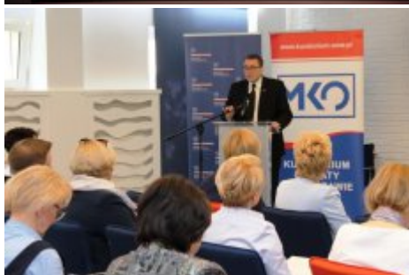
Edukacja dla Polaków na Wschodzie - konferencja