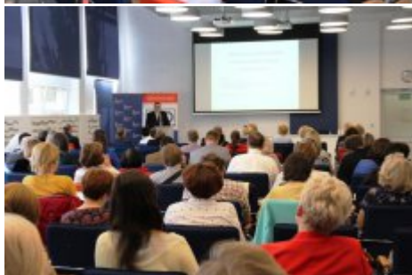
Edukacja dla Polaków na Wschodzie - konferencja