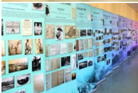
Edukacja dla Polaków na Wschodzie - konferencja

Data publikacji 25.04.2018 Data modyfikacji 26.04.2018