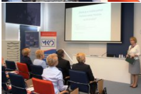
Edukacja dla Polaków na Wschodzie - konferencja