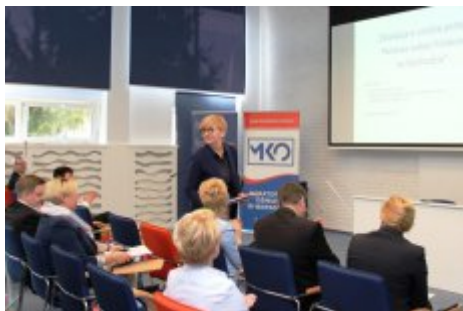
Edukacja dla Polaków na Wschodzie - konferencja