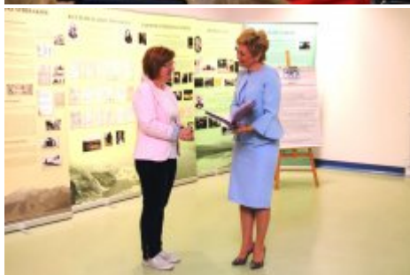
Edukacja dla Polaków na Wschodzie - konferencja