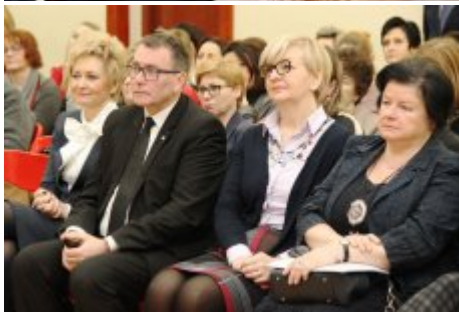
Wielkanocna Akcja Paczka 2018