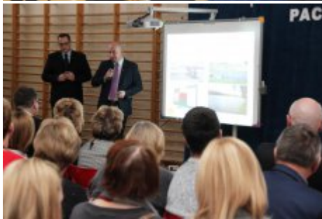
Wielkanocna Akcja Paczka 2018