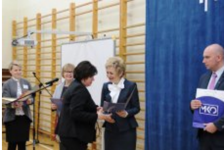
Wielkanocna Akcja Paczka 2018