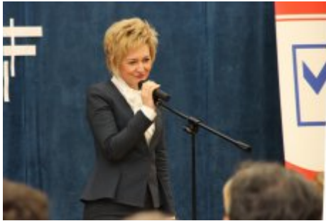
Wielkanocna Akcja Paczka 2018