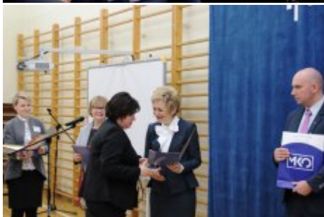
Wielkanocna Akcja Paczka 2018