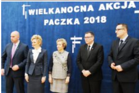
Wielkanocna Akcja Paczka 2018