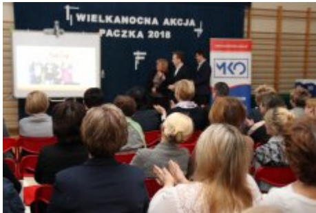
Wielkanocna Akcja Paczka 2018