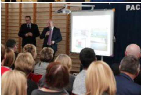
Wielkanocna Akcja Paczka 2018