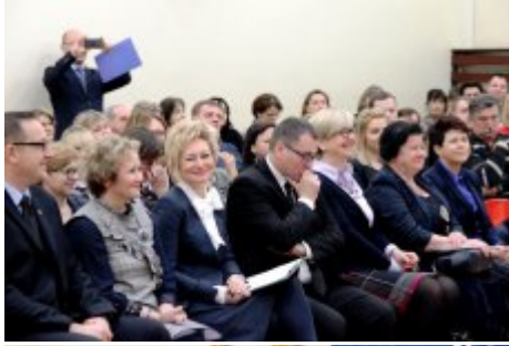
Wielkanocna Akcja Paczka 2018