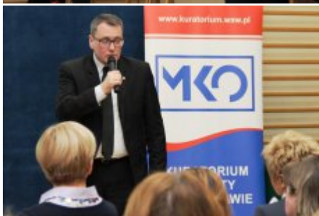
Wielkanocna Akcja Paczka 2018