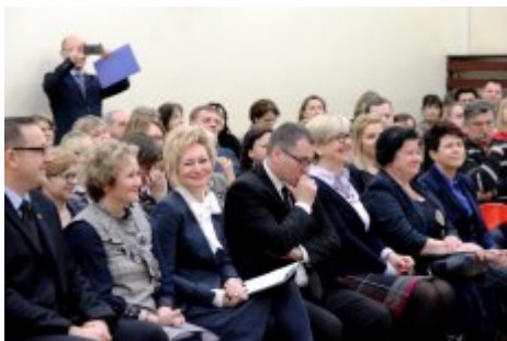
Wielkanocna Akcja Paczka 2018