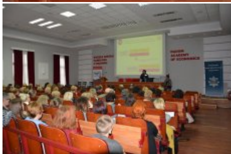
Konferencja w Radomiu

Data publikacji 08.11.2017 Data modyfikacji 08.11.2017