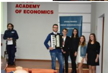
Przedstawienie profilaktyczne - absolwenci Publicznego Gimnazjum im. ks. Biskupa Jana Chrapka w Wierzbicy