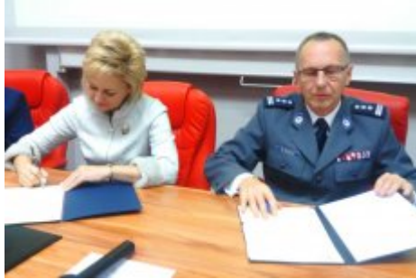
Konferencja w Radomiu