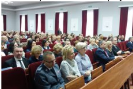
Konferencja w Radomiu