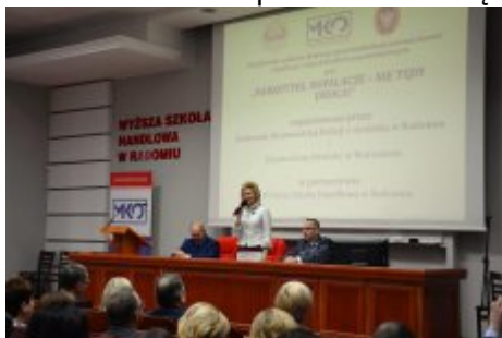
Konferencja w Radomiu