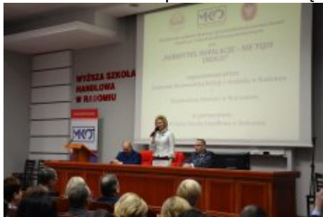
Konferencja w Radomiu