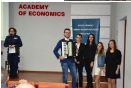
Przedstawienie profilaktyczne - absolwenci Publicznego Gimnazjum im. ks. Biskupa Jana Chrapka w Wierzbicy